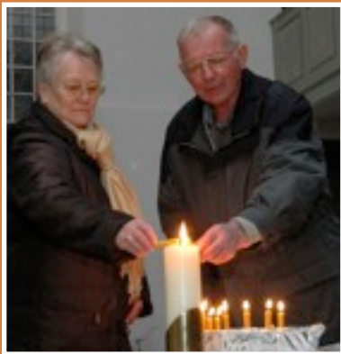
„Ich zünde eine Kerze an ...“