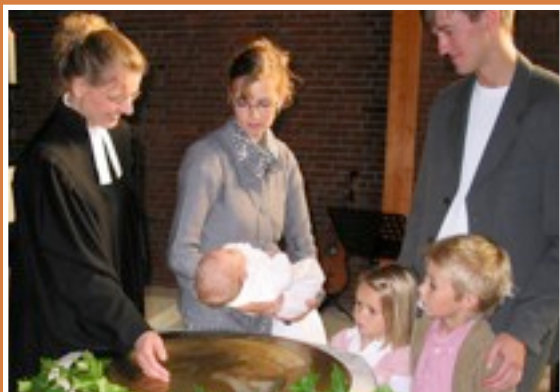
Beginn eines Weges: Die Taufe