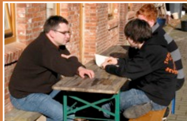
Pastor und Jugendliche bei der Vorbereitung der „Flotte“