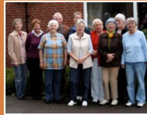
Seelsorge im Ehrenamt: Besuchsdienste