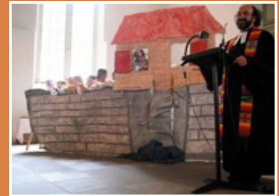
Großer Tag für kleine Leute: Kinderkirchentag