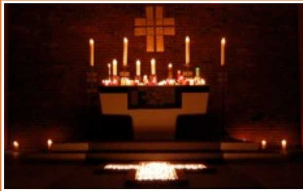
Stimmungsvoll und ruhestiftend::Taizé-Gottesdienste