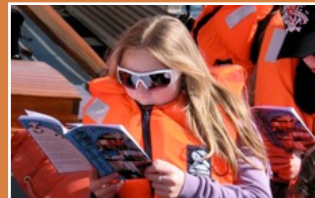
Nicht nur cool, auch inhaltsreich: „Die Flotte“