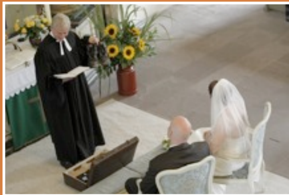
Kein alter Schuh: Die kirchliche Trauung