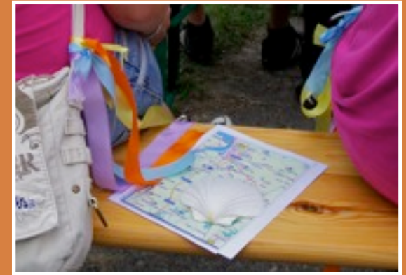
Der Weg ist das Ziel: „Kirche auf dem Rad“