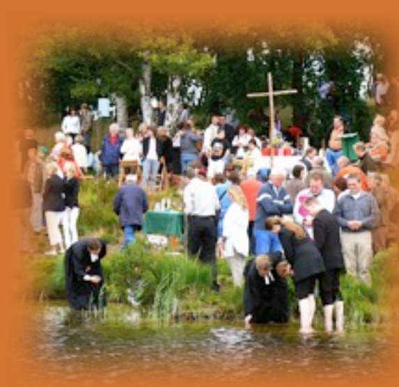
Die Tauffeste im Kirchenkreis waren ein Höhepunkt 2009.

Und so stimmt die Rechnung doch: Ihre Spende trägt direkt dazu bei, dass konkrete Dienste geleistet werden können.